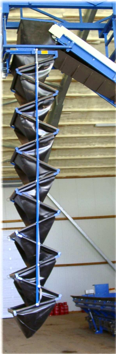
VC 80 - 3,85 m

zur schonenden Übergabe bei größeren Fallhöhen