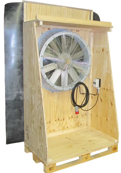
Saugwand MSW 2 ohne Plane